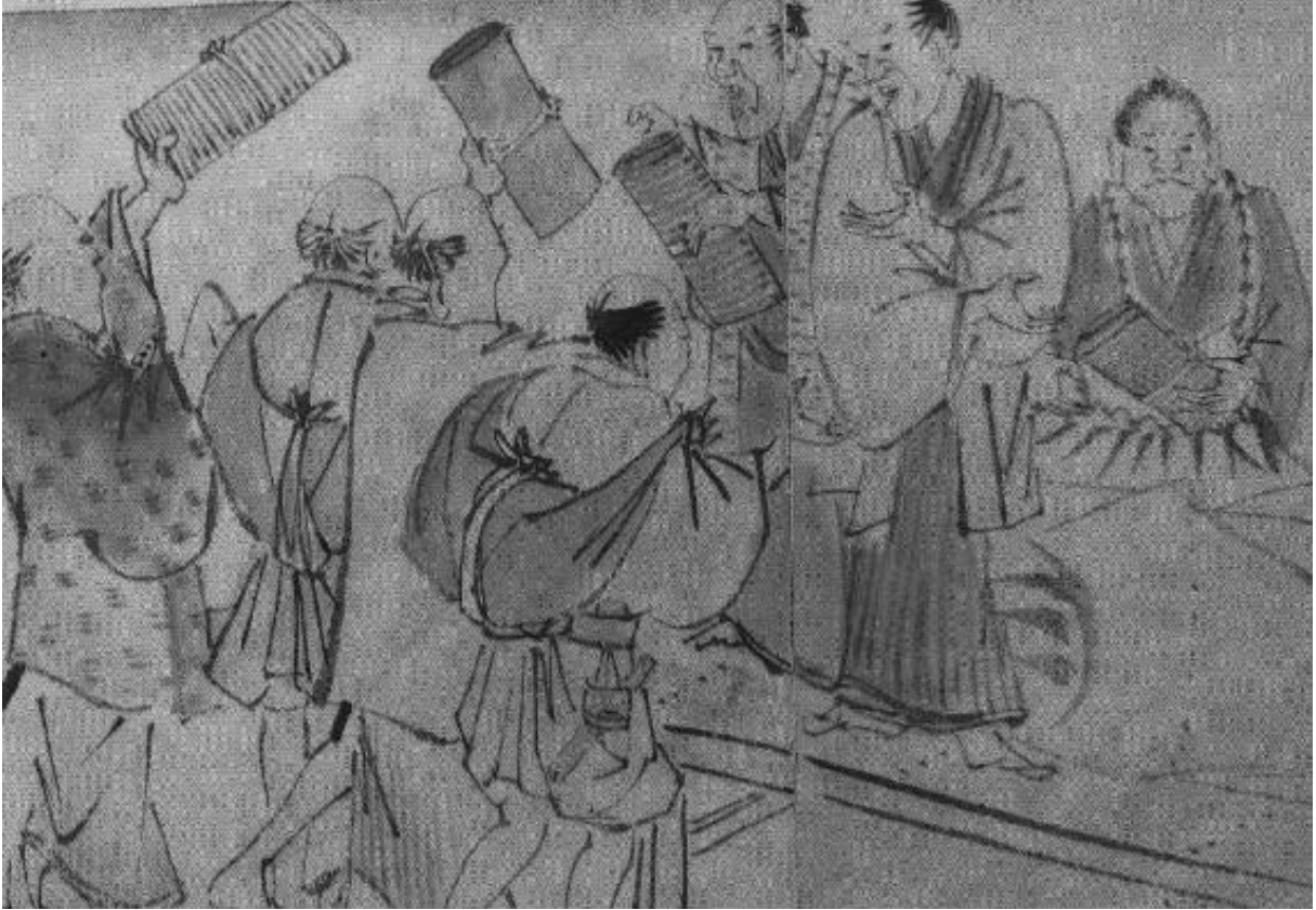
▲ そうとあさいち 桑都朝市 ( そうとにっき 「桑都日記」 ごくらくじほん 極楽寺本より)