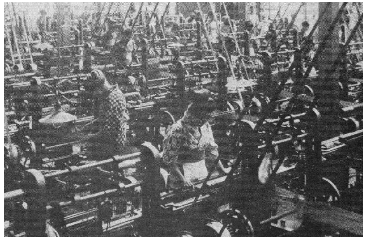
▲織物工場（大正13年）

動力（電力）の機械＝力織機を使って、織物を作る工場が増えていきます。力織機1台で、手織機数台分の織物を作ることができ、生産力が高まるからでした。このころ、有力な機業家がお店を構えて、買継商（機業家から織物を買って全国の消費地の問屋に売る仲買い）と取り引きするようになります。こうして、江戸時代以来行われてきた市も、大正5年（1916）に廃止されました。