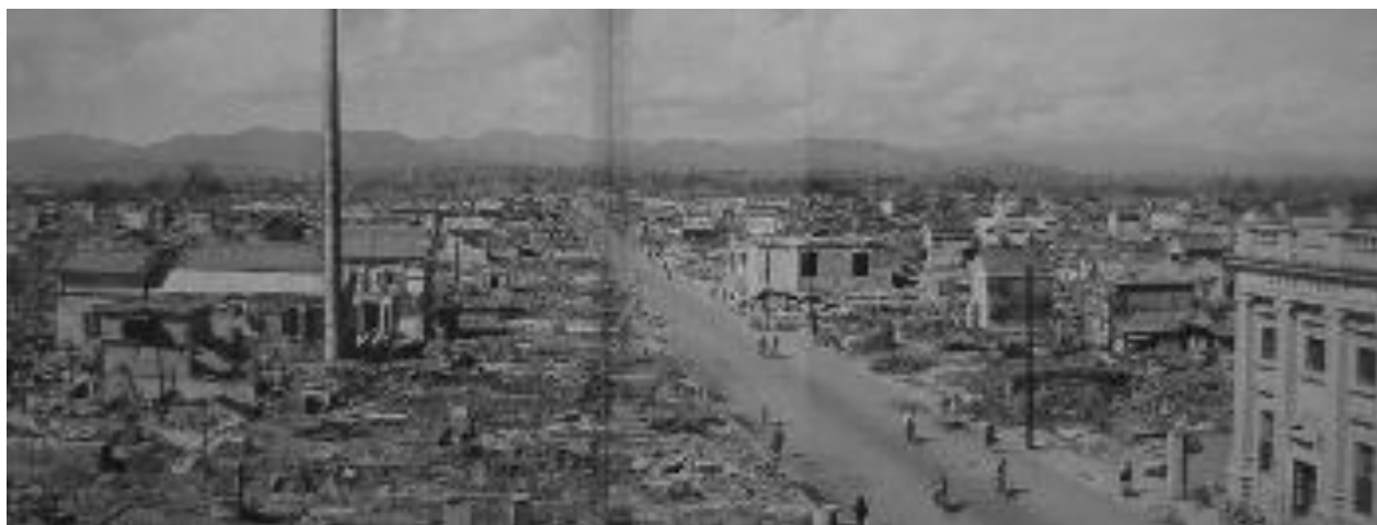
▲空襲をうけた八王子の街並み（昭和 20 年 10 月） 市指定文化財