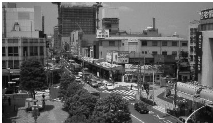
▲現在の八王子市街

八王子の市街地は今、たくさんのビルがたてられ、多くの人々でにぎわっています。こんな八王子にも、今から約 60 年前、空襲がありました。空襲って何だかわかりますか？空襲は、空から爆弾や焼夷弾などを落とし、地上を攻撃することです。八王子空襲で市街は焼け野原となり、たくさんの人が亡くなったりケガをしました。地方都市の空襲の中でも、八王子空襲による被害は特に大きかったといわれます。