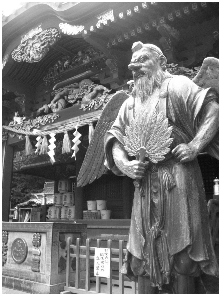
たかおさんやくおういん いづなだいごんげん ▲ 高尾山薬王院 飯縄大権現

みなさんは高尾山に登ったことはありますか？ 日本一急勾配のケーブルカーに乗ったり、登山の途中で、天狗像を目にしたことがある人もいるかもしれません。また、動植物の宝庫である高尾山は、四季折々の顔でわたしたちを楽しませてくれます。