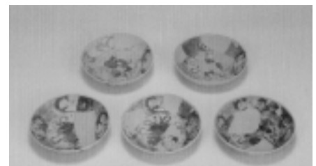
八王子城跡から発掘された 五彩磁器皿

戦さばかりしていた戦国時代の大名にも意外な一面があります。織田信長は珍しい茶道具などを好んで収集していました。八王子城跡からも中国の染付の磁器(原料の石をくわいて高温でやいた、白くて硬いやきもの)や、イタリアで作られたレースガラスなどの外国の珍しい品、茶道具や香炉などが発掘されています。戦さが上手だった氏照ですが、茶の湯やお香を楽しんだり、文化的に豊かな生活を送っていました。