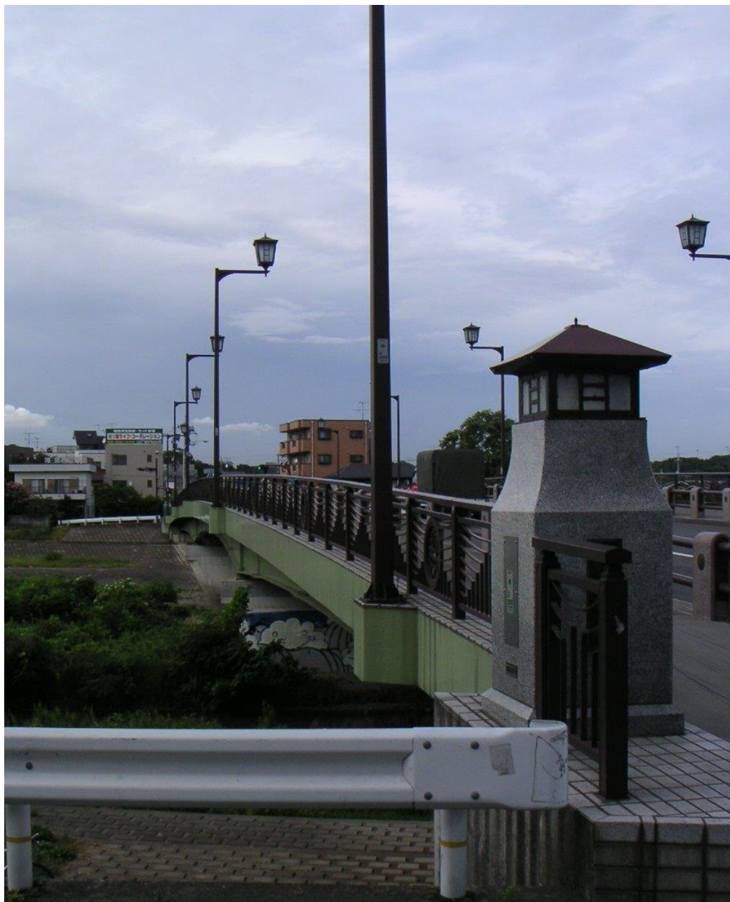
げんざい はぎわらばし ▲現在の萩原橋

浅川に架かる秋川街道の橋、「萩原橋」を知っていますか。浅川には多くの橋が架かっていますが、人の名前が付けられているのはこの橋だけです。