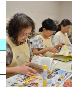
図書館ボランティア