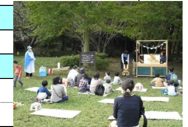
パークライブラリー